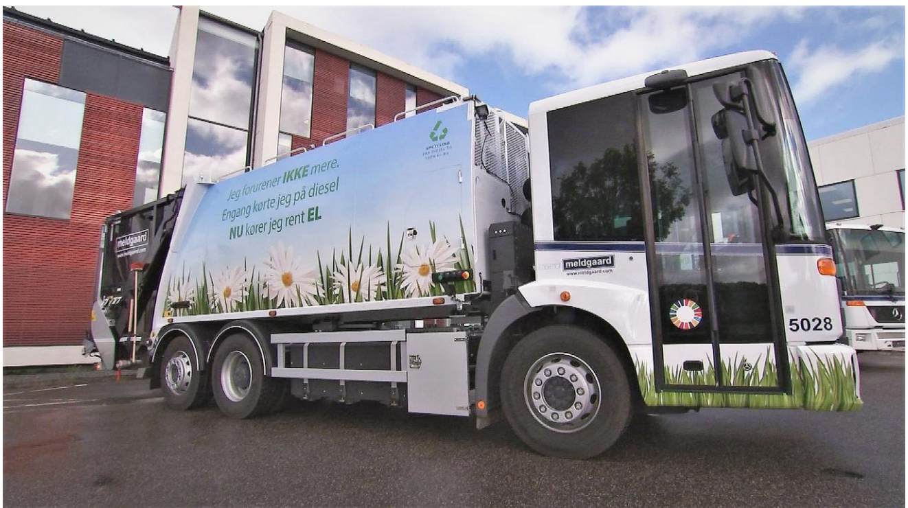
Sådan ser den ud: Måske en af de nye el-skraldebiler i Jegum fra Meldgaard Miljø.

"Vinteren er naturens påmindelse om, at selv når alt ser livløst ud, gemmer der sig potentiale for genfødsel."