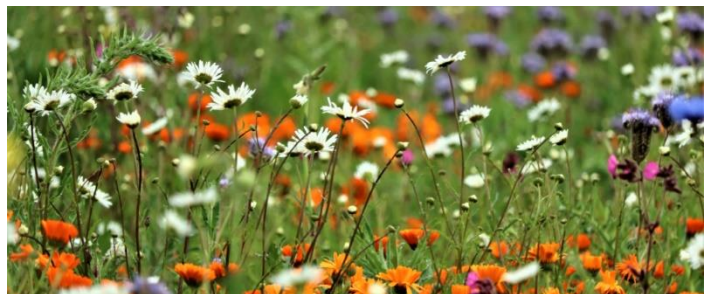
Det forbedrer biodiversiteten, og så er det samtidig smukt at beskue.

-er gennem de seneste år blevet stærkt udfordret i Danmark. Store dele af Danmark er opdyrket som landbrugsjord eller bruges til skovbrug, og det giver udfordringer for både planter og dyr, hvor flere og flere både dyr og planter er truede eller udbredelsen er på vej mod et kritisk lavt niveau. Er der mange arter og en stor variation i levesteder, er der det, man kalder en høj biodiversitet. Biodiversitet skal især sikres i den fri natur, og vi vil gerne hjælpe mangfoldigheden på vej her i Jegum Ferieland.