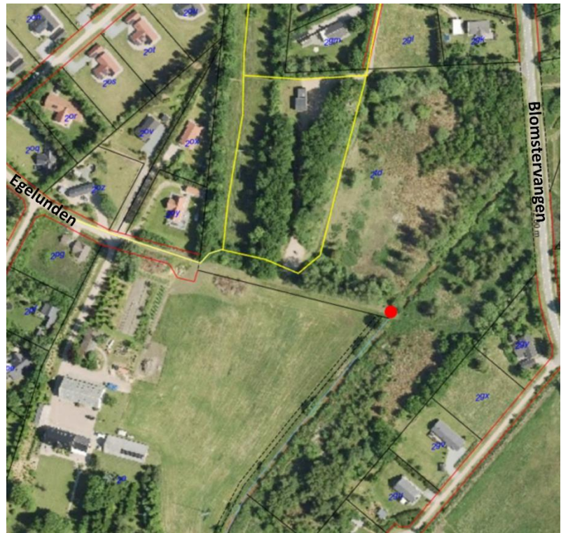
Kortuddraget herover med luftfoto fra sommeren 2020 – den gule linje viser hvor det er muligt at færdes til fods ad en sti og den røde prik viser rørbroen, der blev besigtiget.

På baggrund af luftfotogennemgangen samt de modstridende oplysninger, om der har været en vej eller sti fra Egelunden 12 til rørbroen, vurderer Varde Kommune, at det ikke kan fastslås, at der har været en vej med en så permanent karakter, at denne kan anses for omfattet af naturbeskyttelsesloven. Dette er alene en vurdering i forhold til naturbeskyttelseslovens regler om offentlighedens adgang til naturen. Varde kommune noterer sig at såvel grundejerforeningen som nabolodsejer tilkendegiver, at de er enige om, at det er muligt for områdets beboere at færdes langs det sydlige skel til Egelunden 12 og ind bag læhegnet, hvor grundejerforeningen har en slået sti. Det er således muligt at gå en rundtur i området.