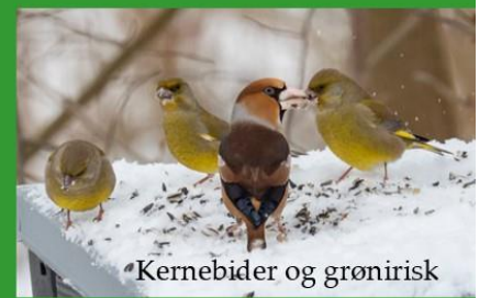
*Kernebidder og grønirisk