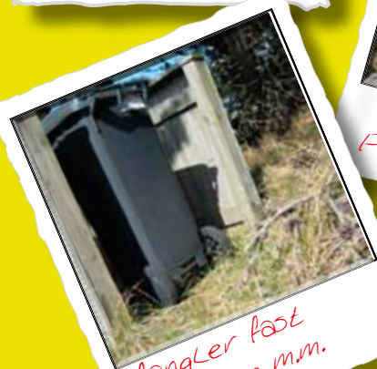
Mangler fast underlag m.m.