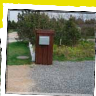
Mangler fast underlag