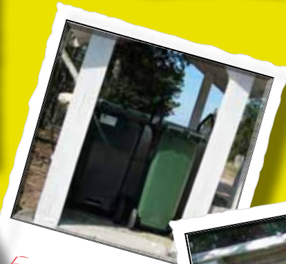
For lidt plads